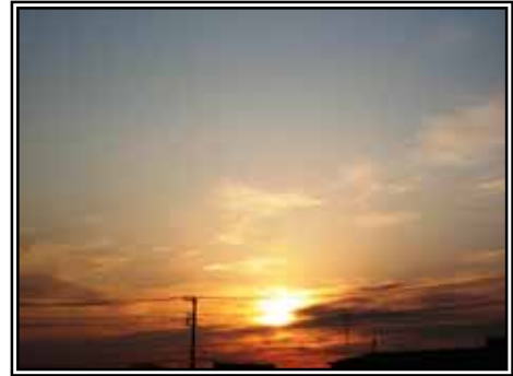
川越市内の橙色の朝日

介護のことならどんなことでも、ご相談に応じます。 介護保険行政からの委託(受託)事業ですから、一切費用等は掛かりませんのでご安心ください。 家族介護での悩みでも何でも・各種の手続き方法の類も含め、お困り等お持ちいただければ幸いです。我々もやりがい生まれます。お気軽に「お茶飲み」にお寄りください。